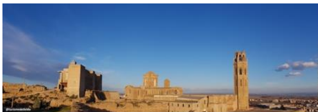
Vista exterior del Turó de la Seu Vella