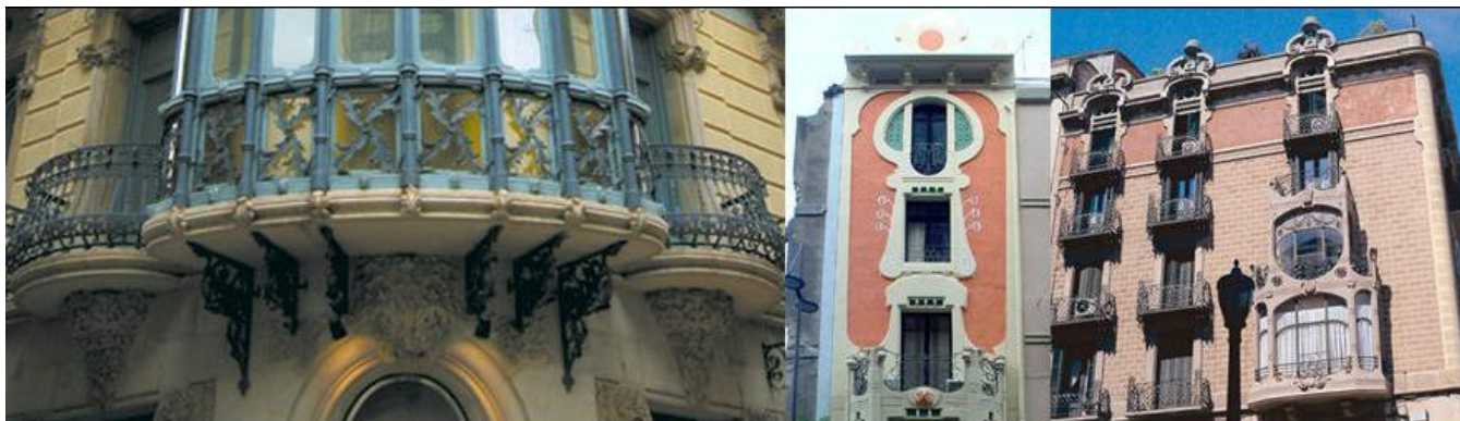
Casa Magí Llorens