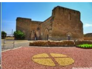
Castell Templar de Gardeny